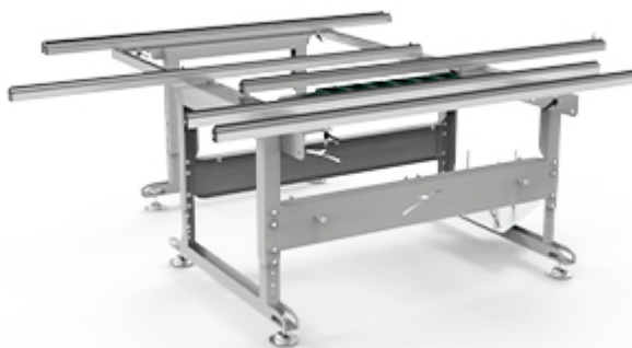
JOB 15 / 2000 JOB 15 / 3000