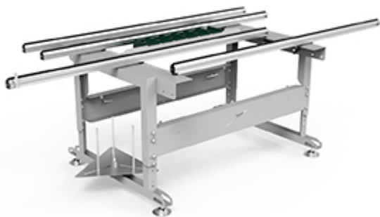
JOB 15 JOB 15 L

Bancada de montagem com barras ajustáveis na mesa de trabalho